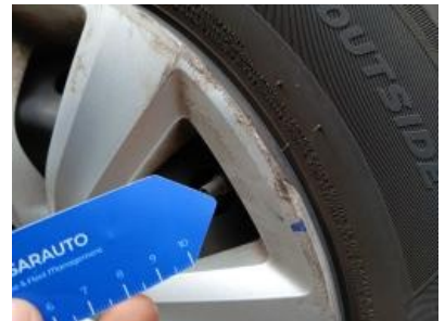
Imagen - 48