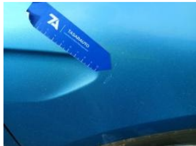
Imagen - 47