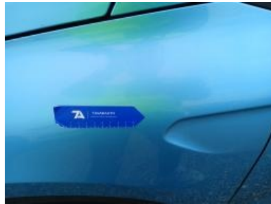
Imagen - 29