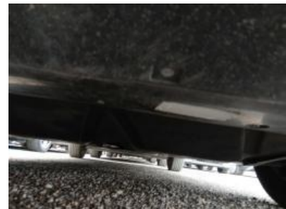
Imagen - 6