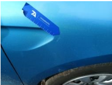
Imagen - 46