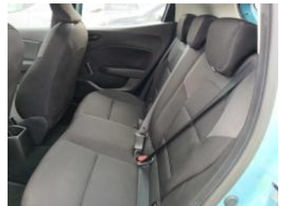
Imagen - 15