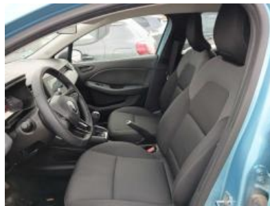
Imagen - 14