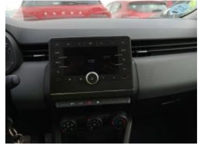
Imagen - 12