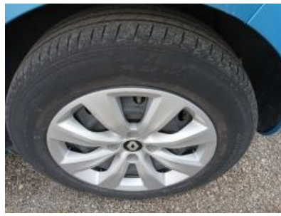
Imagen - 23