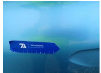
Imagen - 30