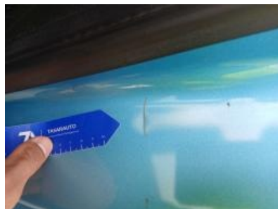
Imagen - 35