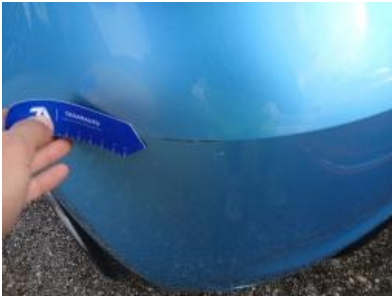
Imagen - 37