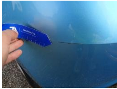
Imagen - 38