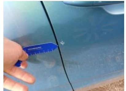
Imagen - 45