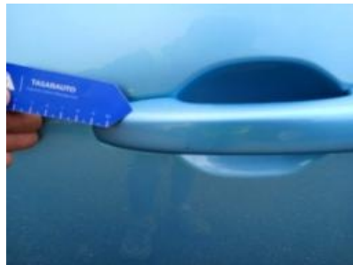
Imagen - 32