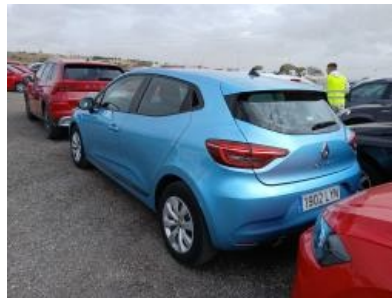
Imagen - 2