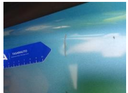
Imagen - 36