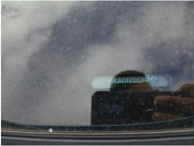
Imagen - 10