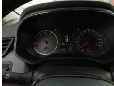
Imagen - 11