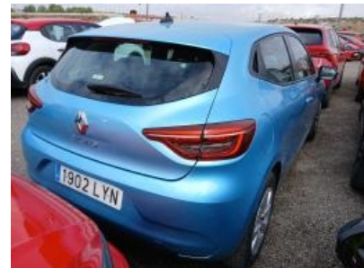
Imagen - 3