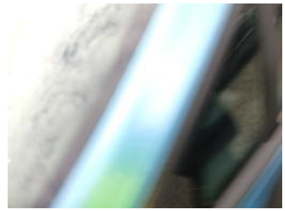
Imagen - 9