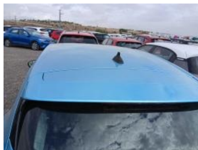
Imagen - 17