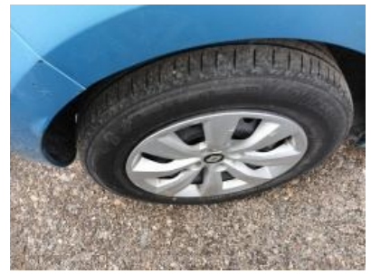
Imagen - 24