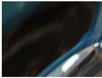
Imagen - 8