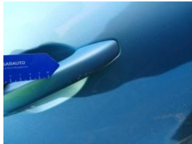
Imagen - 44