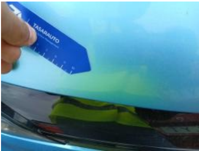
Imagen - 28