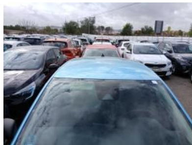
Imagen - 5