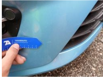
Imagen - 26