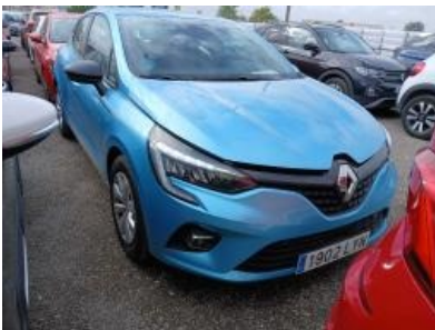
Imagen - 4