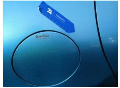
Imagen - 39