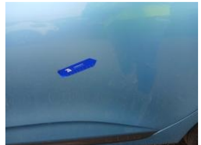
Imagen - 33