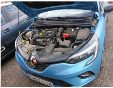
Imagen - 7