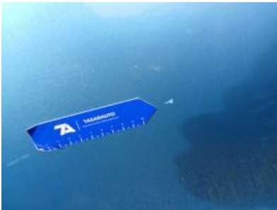
Imagen - 43