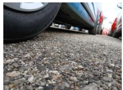
Imagen - 21