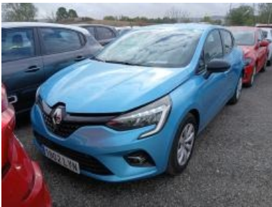
Imagen - 1