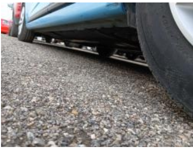
Imagen - 22