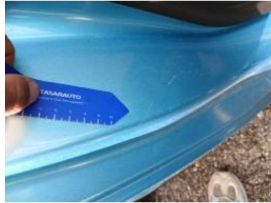
Imagen - 41