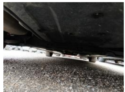
Imagen - 18