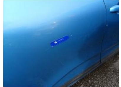
Imagen - 42