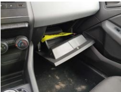
Imagen - 13