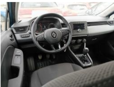
Imagen - 16