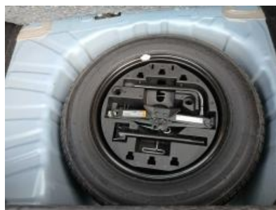
Imagen - 20