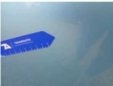
Imagen - 34