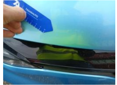
Imagen - 27