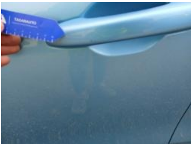
Imagen - 31