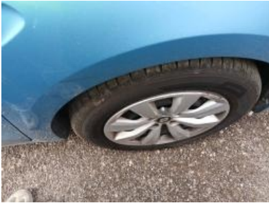
Imagen - 25