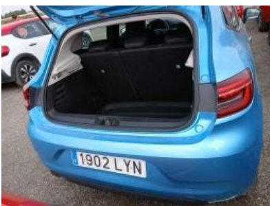
Imagen - 19