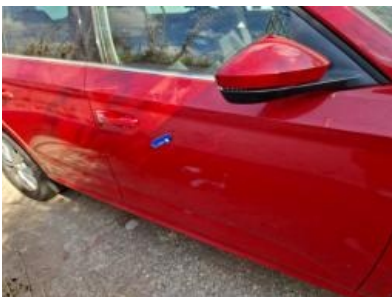
Imagen - 34