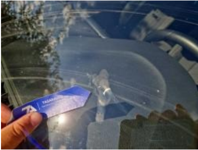
Imagen - 25