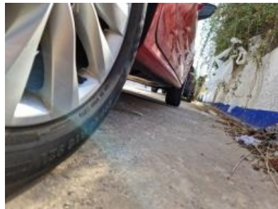
Imagen - 17