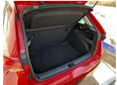
Imagen - 15