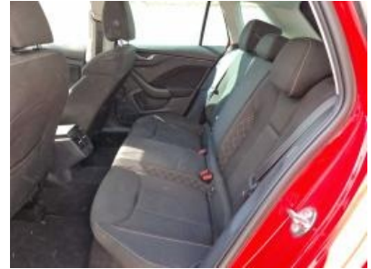
Imagen - 12