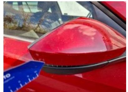
Imagen - 33