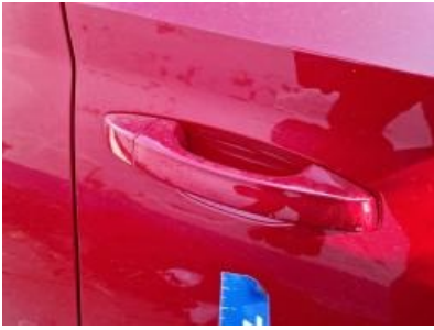
Imagen - 37