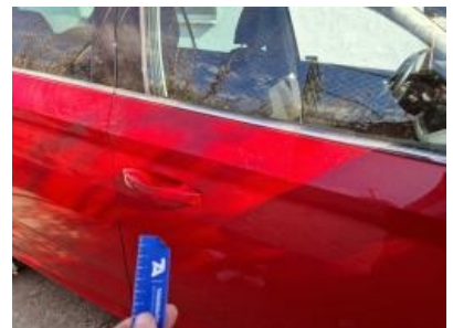
Imagen - 36