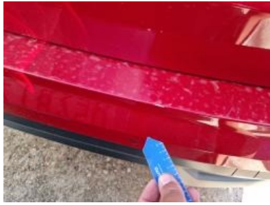
Imagen - 38