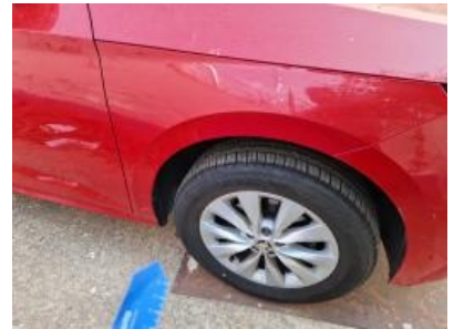
Imagen - 30