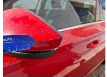
Imagen - 27