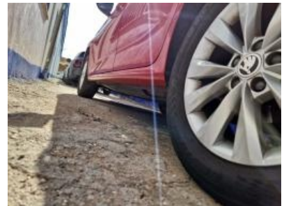
Imagen - 18