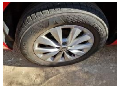
Imagen - 21