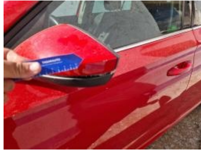
Imagen - 26