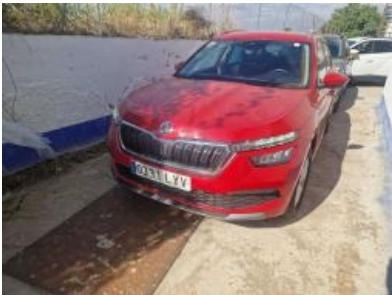
Imagen - 1