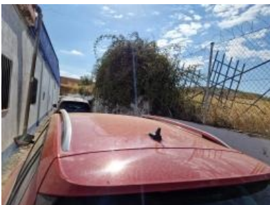
Imagen - 19