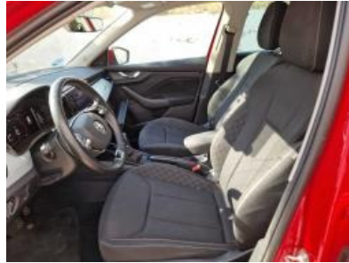
Imagen - 11