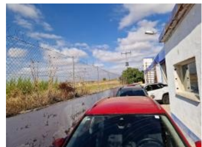
Imagen - 6