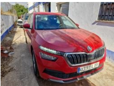
Imagen - 4