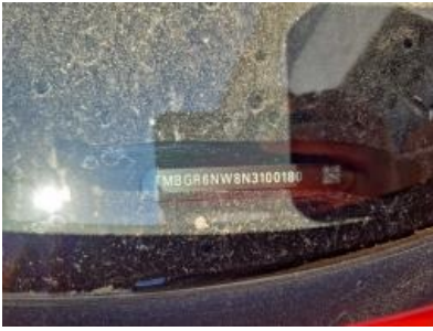
Imagen - 7