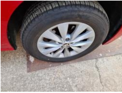
Imagen - 22