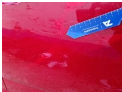
Imagen - 35