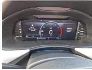
Imagen - 8