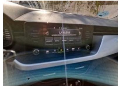
Imagen - 9