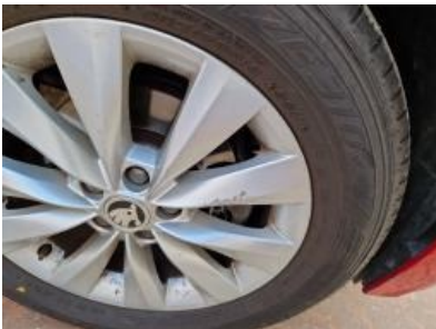
Imagen - 31