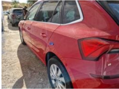
Imagen - 41