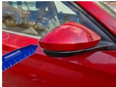
Imagen - 32