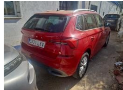
Imagen - 3