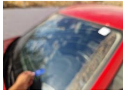
Imagen - 24