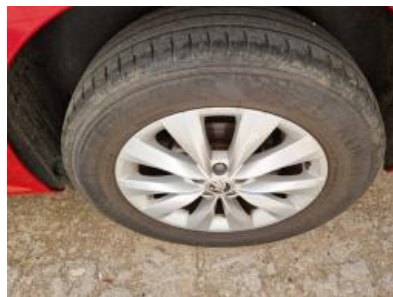
Imagen - 20