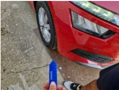
Imagen - 28