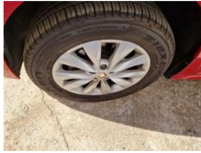
Imagen - 23