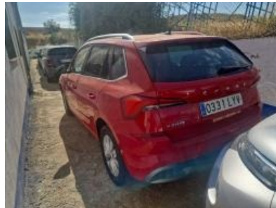
Imagen - 2