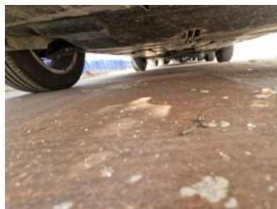
Imagen - 5