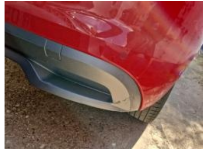
Imagen - 39