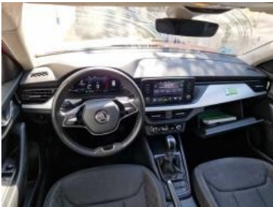
Imagen - 13