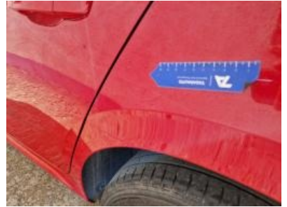
Imagen - 42