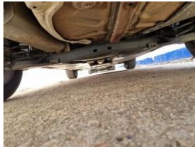
Imagen - 14