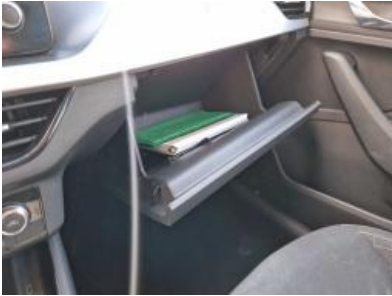
Imagen - 10