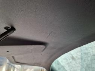
Imagen - 40