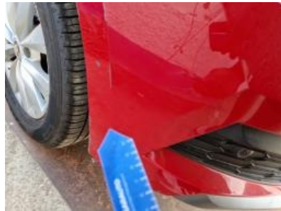
Imagen - 29